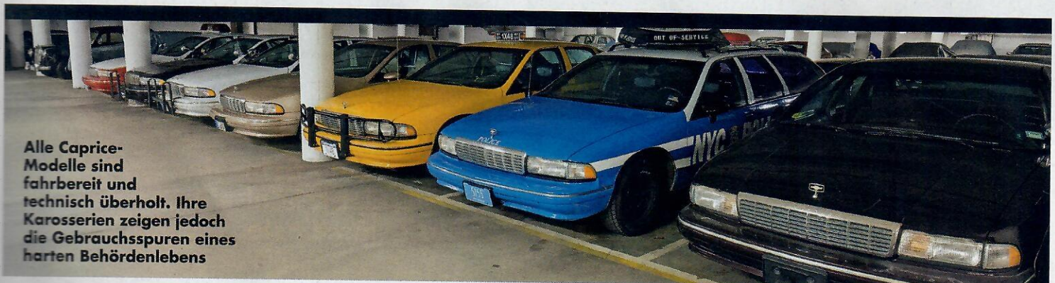
Alle Caprice-Modelle sind fahrbereit und technisch überholt. Ihre Karosserien zeigen jedoch die Gebrauchsspuren eines harten Behördenlebens

Bauzeit und Stückzahl Caprice vierte Generation 1991 bis 1996. Insgesamt 689 257 Einheiten